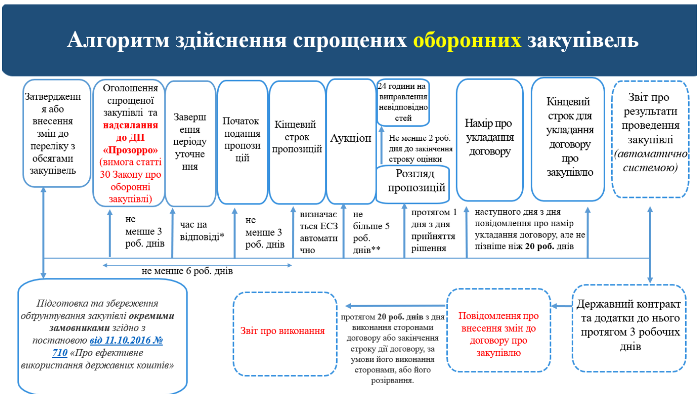
Схема здійснення спрощених оборонних закупівель

Публікації, тематикою яких є особливості здійснення закупівель для потреб оборони, зібрані у розділі « Оборонні закупівлі »: